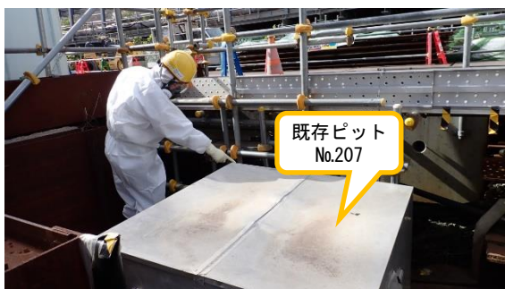
(写真 1) サブドレンピットNo. 207 (既存) の状況