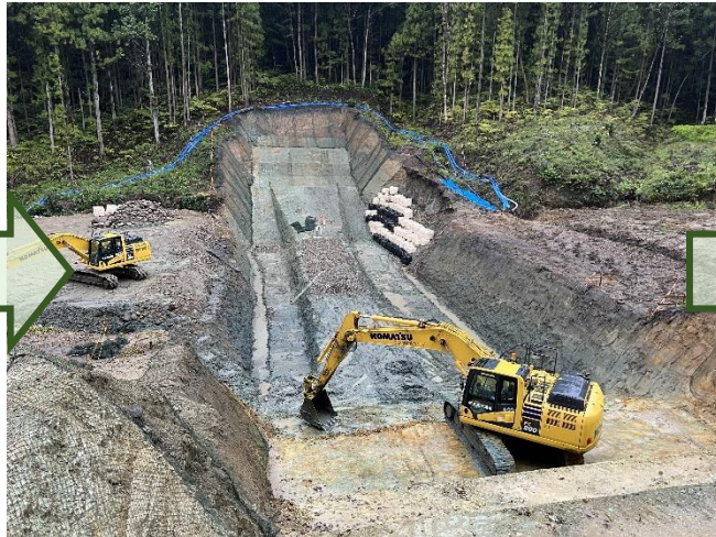
令和3年10月 えん堤部掘削工