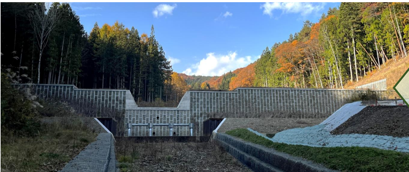
令和6年11月 宮ノ沢砂防えん堤完成