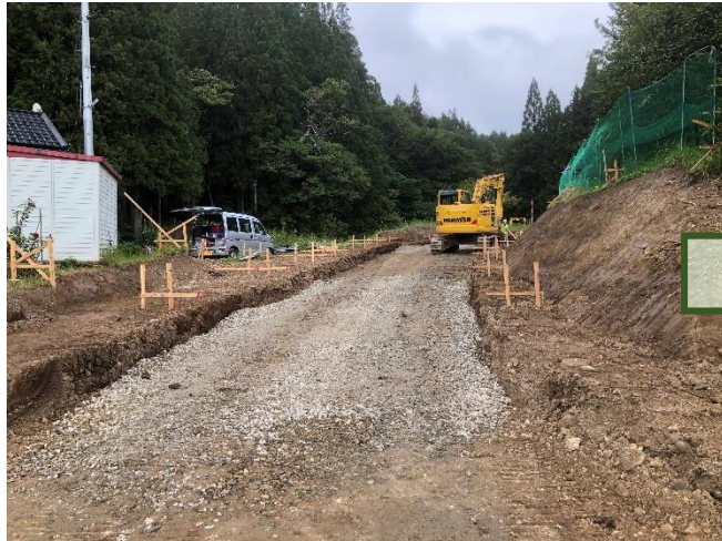
令和2年9月 工事用道路工