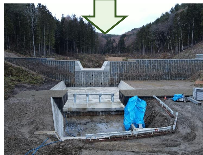
令和5年11月 本堤、副堤、流木止め完成