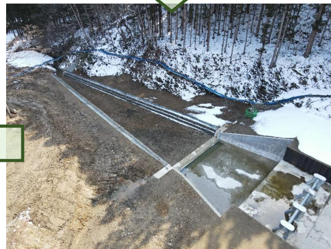
令和6年3月 流末処理工完成