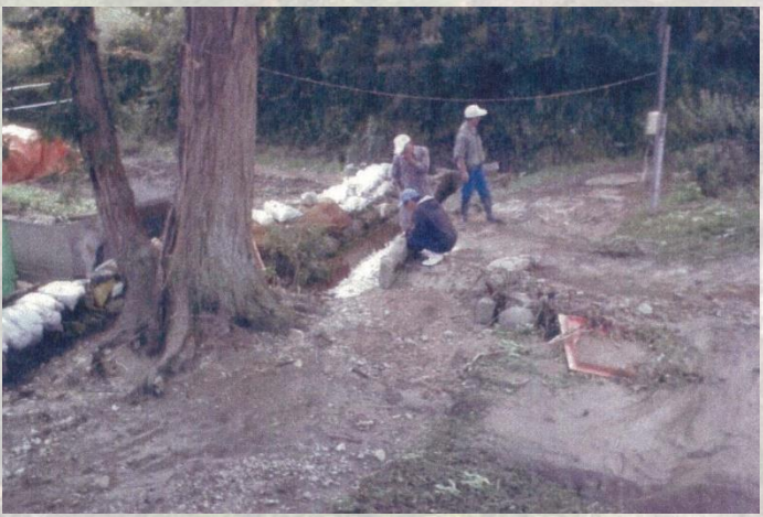
▶ 人家への土砂流出