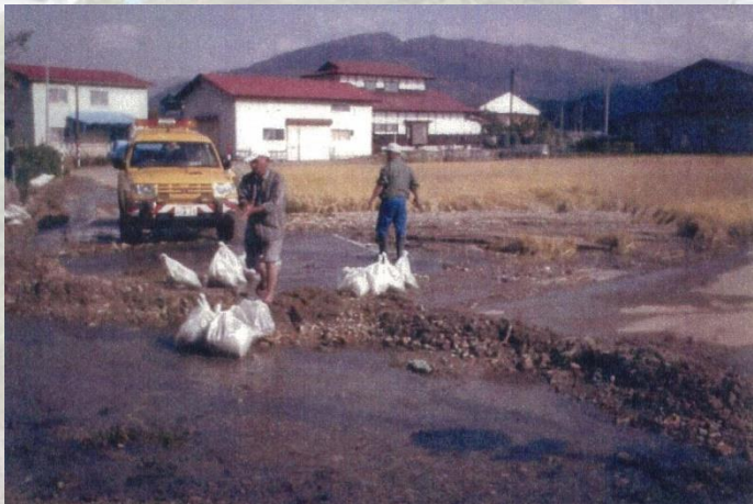
◀ 町道への土砂流出