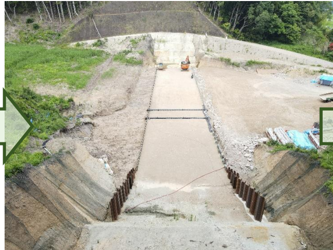
令和4年7月 本堤下部工（矢板）