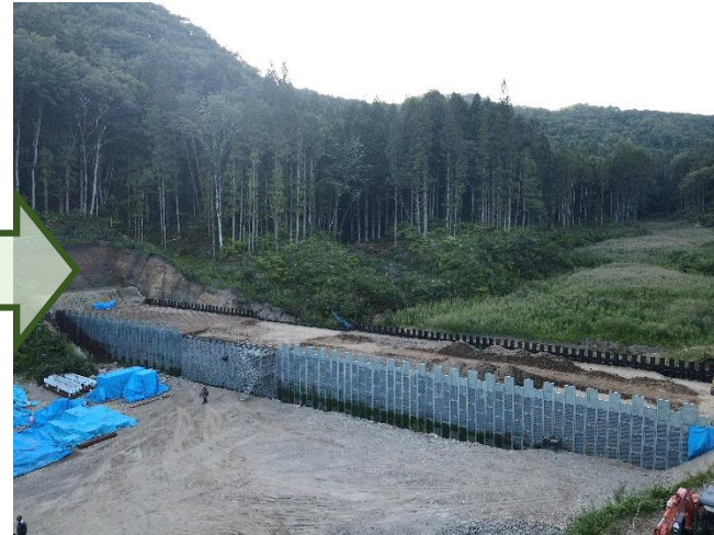
令和4年9月 本堤上部工（壁面材）