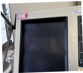
医療機器ごとのバッテリー駆動時間を把握することで、停電時でも効率的な機器運用を行えるよう工夫しました。