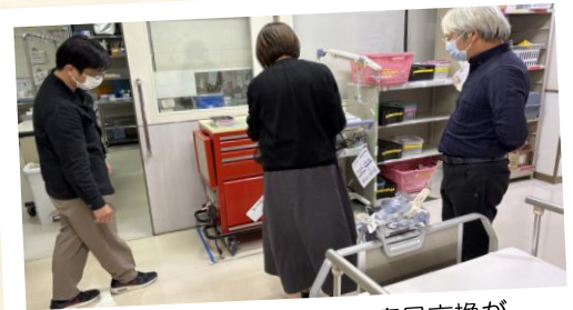
ラウンド中に自由闊達な意見交換が行われました。

今後も定期的にラウンドを実施し、職員一人一人の医療安全への意識の向上に努めてまいります。