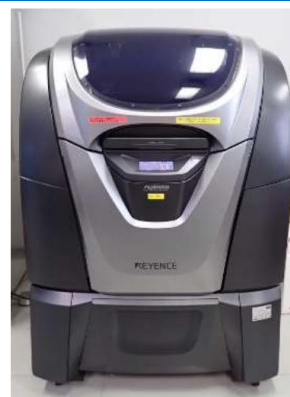
3Dプリンター (AGILISTA-3200) (4,620円/時間)