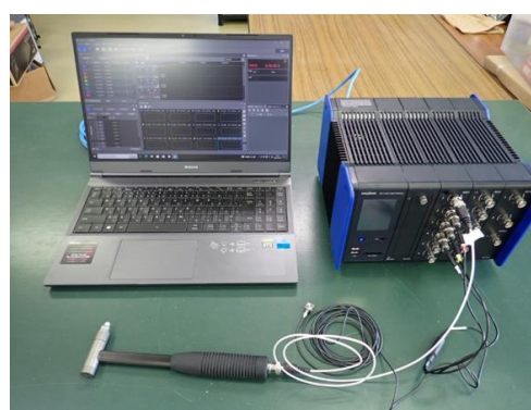
ハンマリング振動測定システム (1,980円/時間)