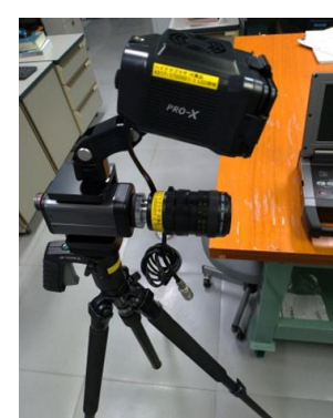
ハイスピードカメラ (1,290円/時間)

○その他の施設・設備は、福島県ハイテクプラザ 施設・設備データベースからご覧いただけます。