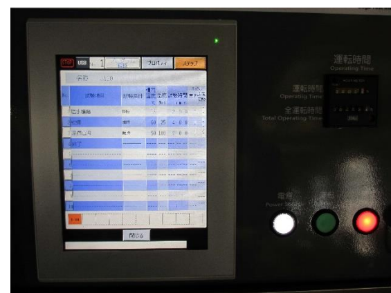
コントロールパネル