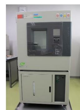
低温恒温恒湿槽 (410円/時間)

○その他の施設・設備は、福島県ハイテクプラザ 施設・設備データベースからご覧いただけます。