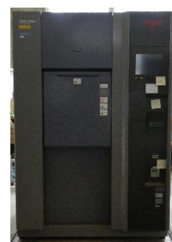
熱衝撃試験機 (1,450円/時間)