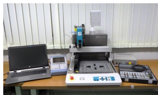
ノイズ源探索装置 (4,050円/時間)