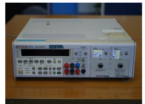
デジタルマルチメータ (310円/時)

○その他の施設・設備は、福島県ハイテクプラザ 施設・設備データベースからご覧いただけます。