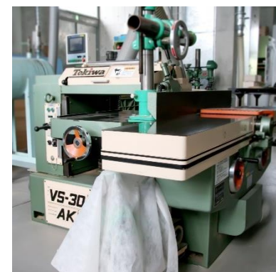
手押鉋・自動鉋兼用機 (440円/時間)

○その他の施設・設備は、福島県ハイテクプラザ 施設・設備データベースからご覧いただけます。