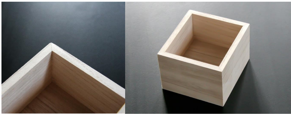
桐箱（角は45°カットで製作）