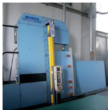
システムパネルソー (680円/時間)