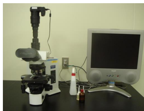
微生物顕微鏡 (500円/時間)