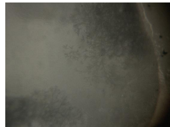
米麴の観察(左:孢子形成の様子、右:菌糸の蒸米への侵入)