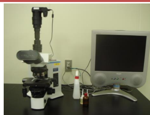
微生物顕微鏡 (500円/時間)

○その他の施設・設備は、福島県ハイテクプラザ 施設・設備データベースからご覧いただけます。