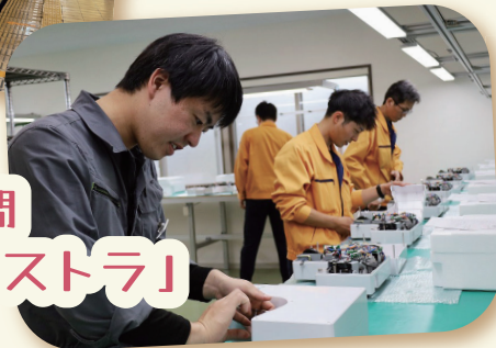
企業訪問 「株式会社 アストラ」