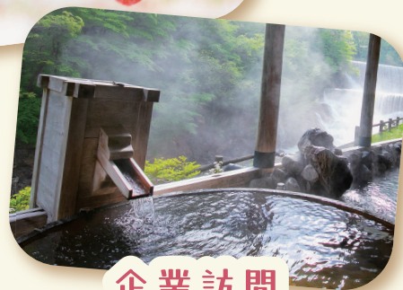
企業訪問 「株式会社 山水荘」