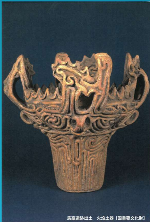
馬高遺跡出土 火焔土器【国重要文化財】