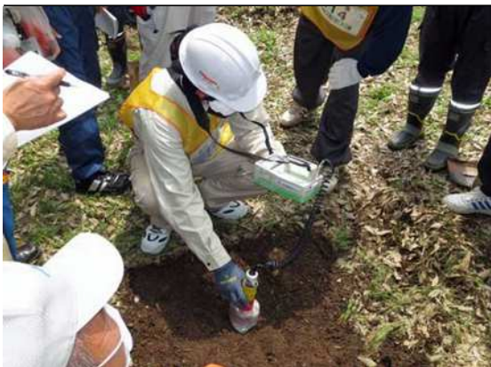
コリメータ使用し線量確認