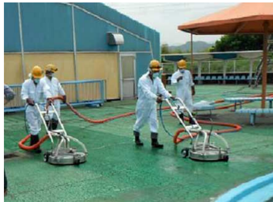
同時吸引型高圧洗浄実施