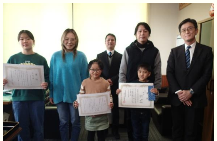
R6.12.16 古殿町立古殿小学校 (佳作、奨励賞、学校賞)