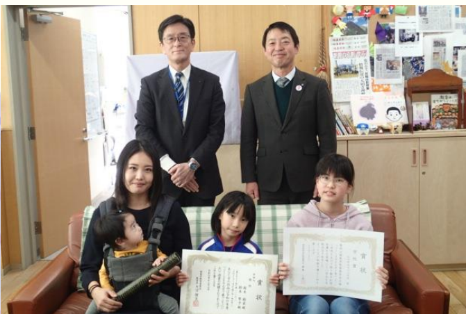
R6.12.16 石川町立石川小学校 (佳作、学校賞)