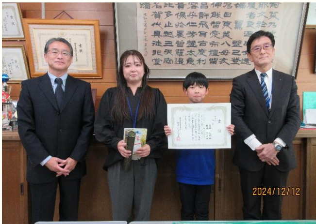
R6.12.12 郡山市立薫小学校 (佳作)