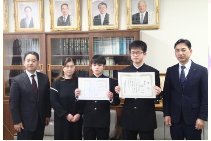
R6.12.12 郡山市立郡山第一中学校 (優秀賞、奨励賞)