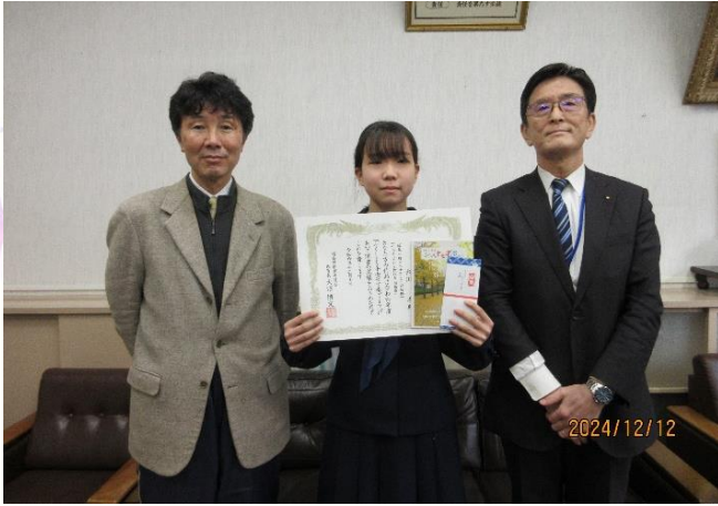
R6.12.12 郡山市立郡山第四中学校 (佳作、学校賞)