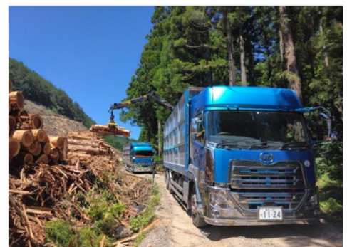
■ 間伐材搬出の支援