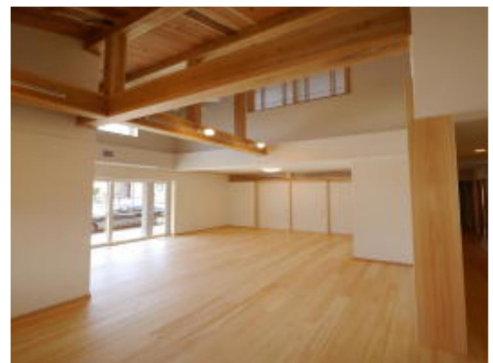
■ ポイント交付住宅