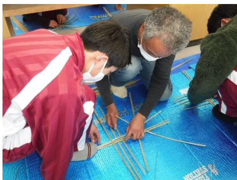
■森林文化出前講座