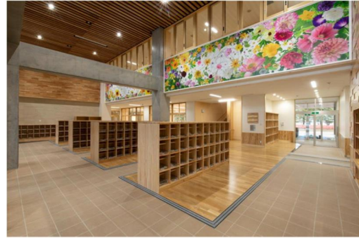
■ 県産材の利活用推進（地域提案重点枠）