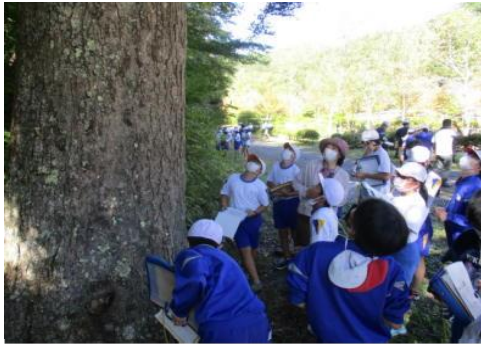
■ 森林環境学習を支援（森林環境基本枠）

た、図書館等の市町村有施設や小中学校、幼稚園等の施設において、県産材を使った木製品の導入 44 件、施設の内装木質化 44 件を実施しました。