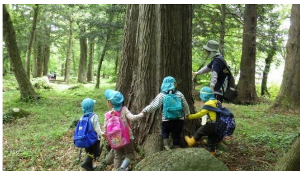
■子ども里山教育支援事業