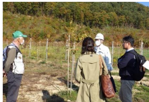
■ もり 森林の未来を考える懇談会