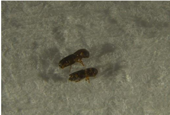
写真1 サクセスキクイムシ成虫