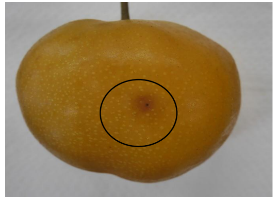
写真2 果実表面の食入痕