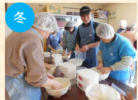
味噌づくり体験 (1月～2月)