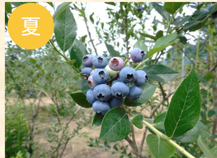
ブルーベリー摘み取り体験 (7月～9月)