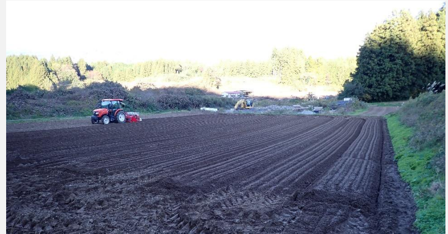
【大麦播種の様子(埴町)】