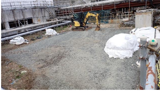
(写真 1) No. 1 重油タンク跡地の状況