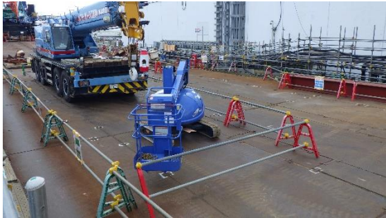
(写真 2-1) No. 1 重油タンク解体物保管エリアの 状況①