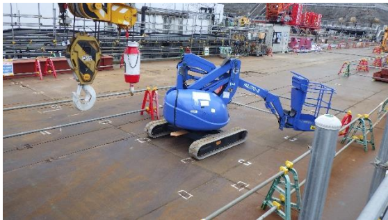
(写真 2-2) No. 1 重油タンク解体物保管エリアの 状況②