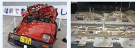
▲ 展示曾遭受海嘯衝擊的消防車。 ▲ 透過立體透視模型觀察事故後的東京電力福島第一核能發電廠。