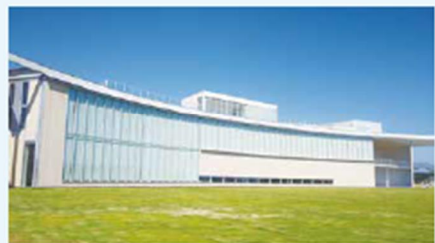
▲ 與周邊的自然景觀融為一體的建築，由屋頂透視，可一覽無遺的景緻。