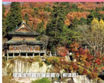
福島古宮 菅原 風藏寺 (柳津町)