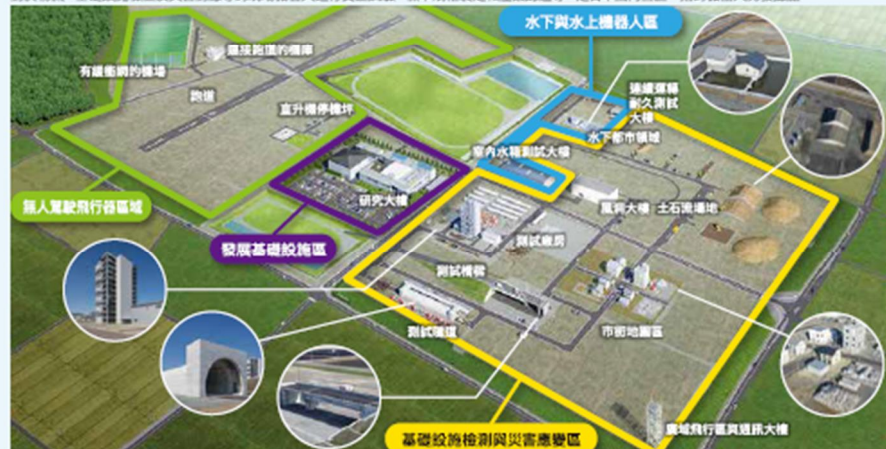
Copyright © 2017 Fukushima Prefecture, All Rights Reserved.

對於物流、基礎設施檢查及災害對應等的現場機器人進行實証試驗、標準規格制定和產品認證等，是日本國內最先一手的機器人開發據點