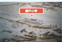
▲ 地震發生時的情形

縣內唯一處能將海嘯的威脅傳達予後世的震災遺址。該校位處距離海岸約300m之地，災難當下由於教職人員們迅速的判斷和學童們的配合協力，奇蹟般地全體安全避難。迄今，災害當時的樓梯仍猶如故地遺留於此。