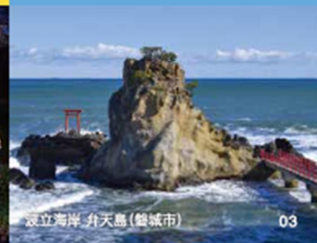
浪立海岸 弁天島 (磐城市)