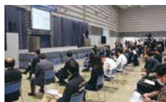
ロボット・航空宇宙フェスタふくしま

○県内外の企業等から寄せられる事業連携希望や発注情報等に対応可能な会員企業を選定し、マッチング支援を行います。