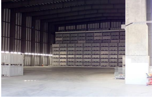
(写真 1-1) 固体廃棄物貯蔵庫第 10 棟内部の状況 ※コンテナの取り扱い作業はしていない