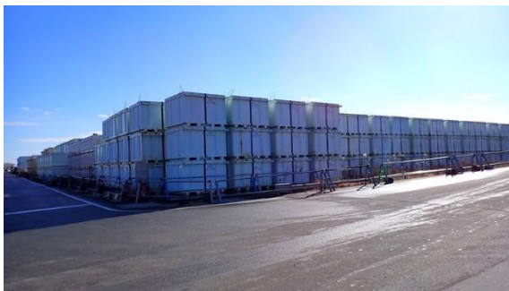
(写真 1-3) 瓦礫類一時保管エリアにおけるコンテナ保管の状況