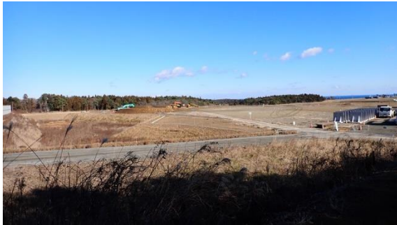
(写真 1-2) 土捨て場の状況