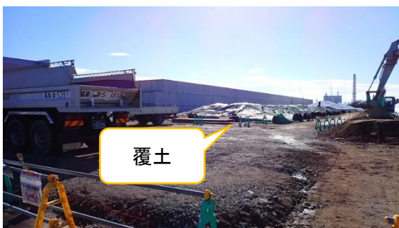
(写真 1-4) 覆土式一時保管施設の状況