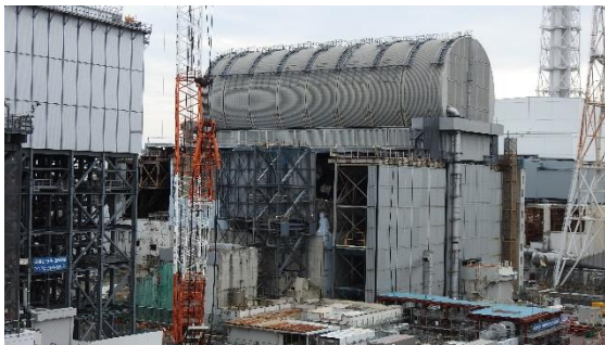
(写真 2) 2～4号機原子炉建屋の状況