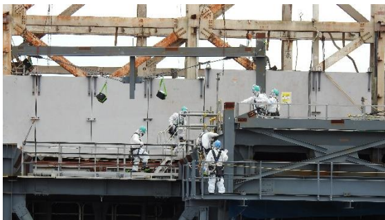
(写真 1 ③) 上部架構の設置作業