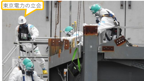
(写真 1 ④) 東京電力社員の立会