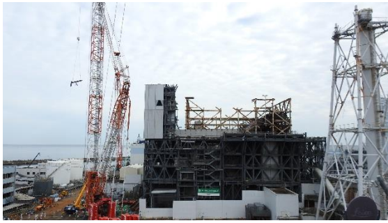
(写真 1 ①) 1号機原子炉建屋西側