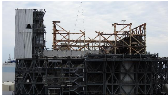
(写真 1 ②) 上部架構の吊上げ