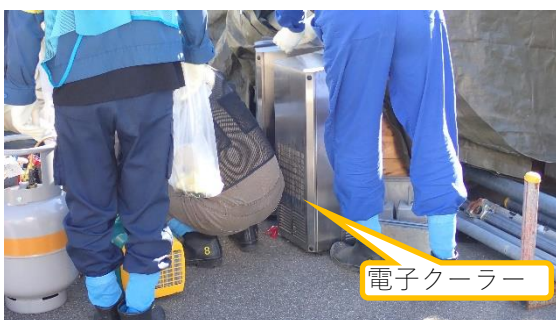
(写真1-2) 回収した電子クーラー