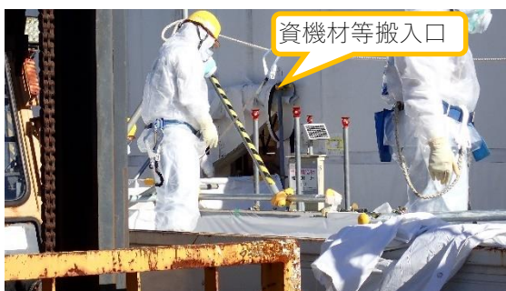
(写真3-2) R01建屋内への資機材等搬入口の 状況