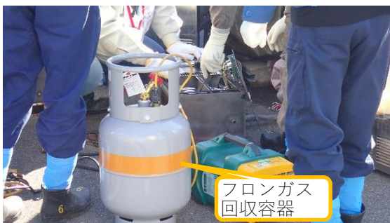
(写真1-1) フロンガス回収作業の状況