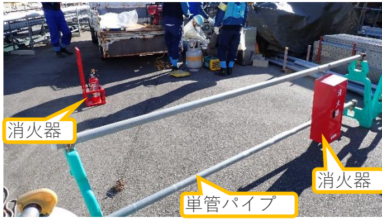
(写真2) 作業エリアの区画状況及び消火器の 配備状況