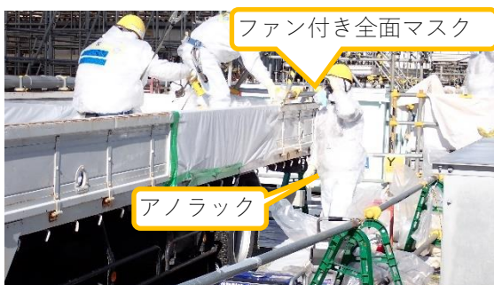
(写真4) アノラック及びファン付き全面マス クの装備状況