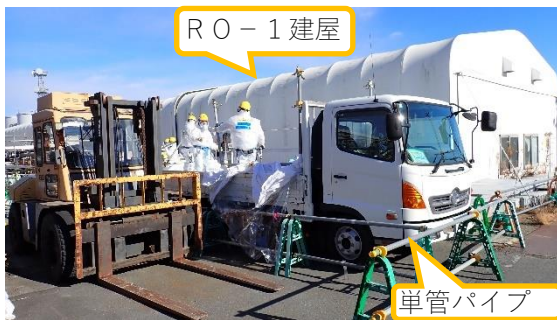
(写真3-1) トラック荷台に積載している機材及 び廃材のR01建屋内への搬入作業 状況