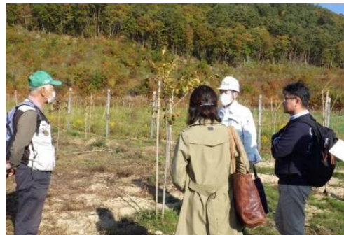
■ もり 森林の未来を考える懇談会