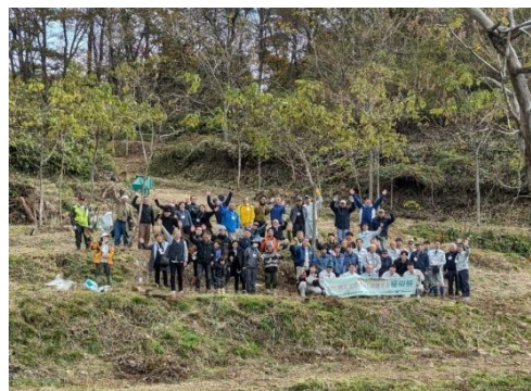
■会津桐玉植苗植樹祭