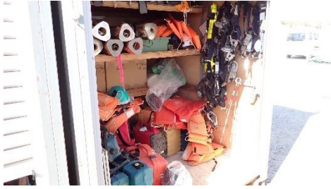
(写真5) 安全帯や救命胴衣等の保管状況