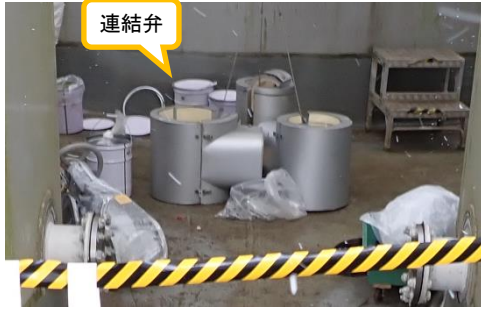
(写真6) J9タンクエリア堰内の状況