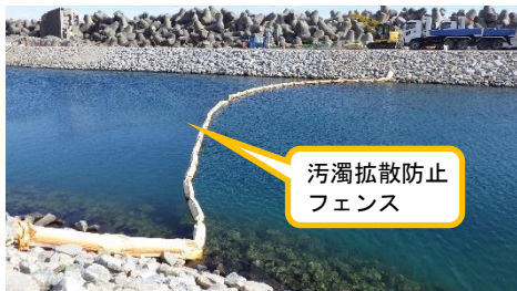
(写真3) 汚濁拡散防止フェンスの状況