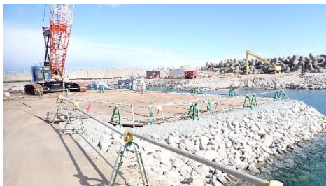
(写真2-1) 捨石マウンドの状況① (令和7年2月7日撮影)