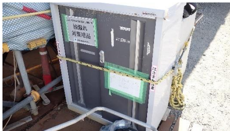
(写真4) 油漏れ対策用品の保管状況