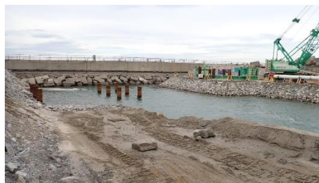
(写真2-2) 捨石マウンドの状況② (令和6年10月23日撮影)