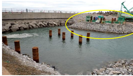
(写真1-2) 栈橋の状況② (令和6年10月23日撮影)