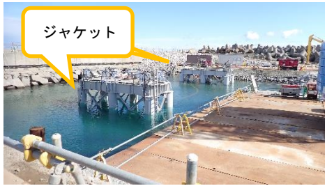
(写真1-1) 栈橋の状況① (令和7年2月7日撮影)