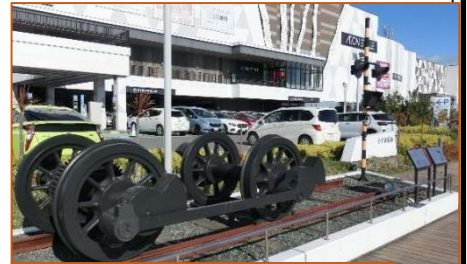
小名浜駅の歴史を伝えるモニュメント

さらに歴史をさかのぼると、昭和41年頃までは、小名浜からなんと、江名（安竜団地入口付近）まで旅客用の鉄道が運行されていました。皆さんも小名浜から江名間でかつて活躍した鉄道の痕跡を探してみるのはいかがでしょうか？