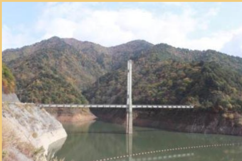
日中大橋と紅葉(平成 25 年 10 月 30 日)