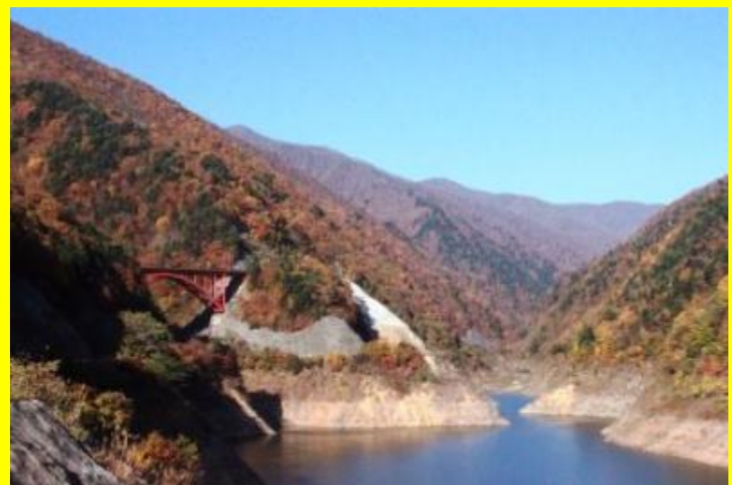
日中大橋からの秋景色(平成 25 年 11 月 6 日)