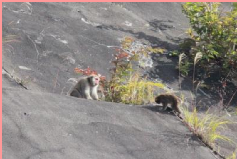
ダム付近で猿発見(平成 25 年 10 月 2 日)