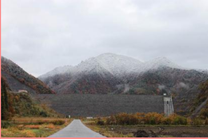
ダムにも雪が降りました(平成 24 年 11 月 14 日)