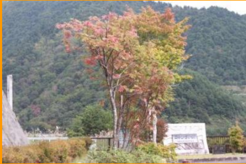
紅く色づいてきた、ななかまどの葉(平成 25 年 9 月 25 日)