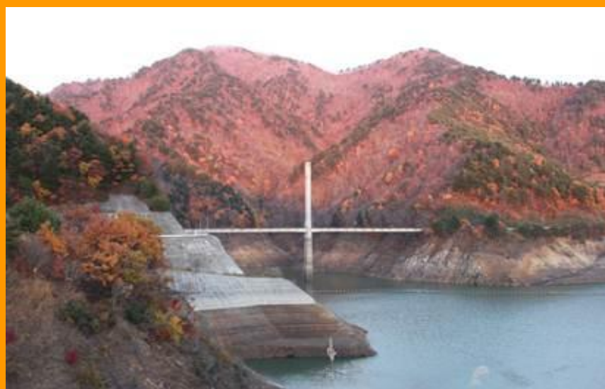
夕日でピンク色に染まった山々(平成 24 年 11 月 16 日)