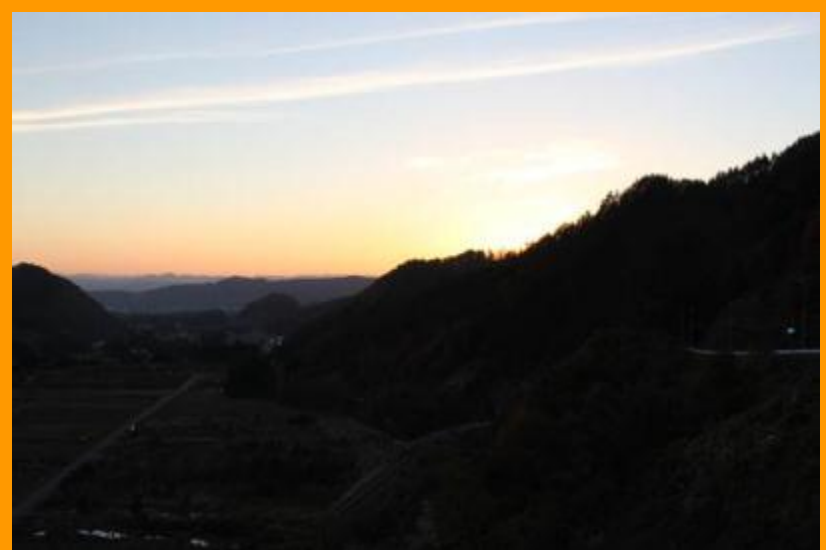
ダムから見た夕日(平成 24 年 11 月 16 日)