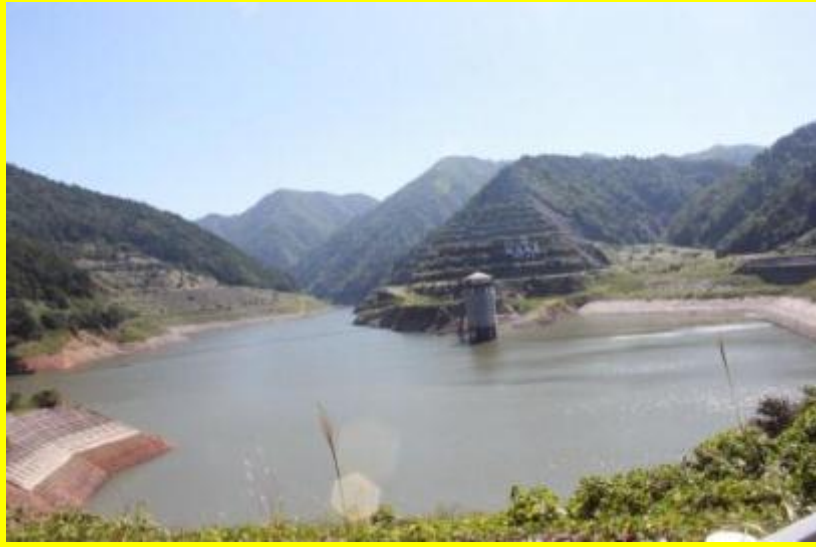
平年並みの貯水量のダム(平成 25 年 9 月 18 日)