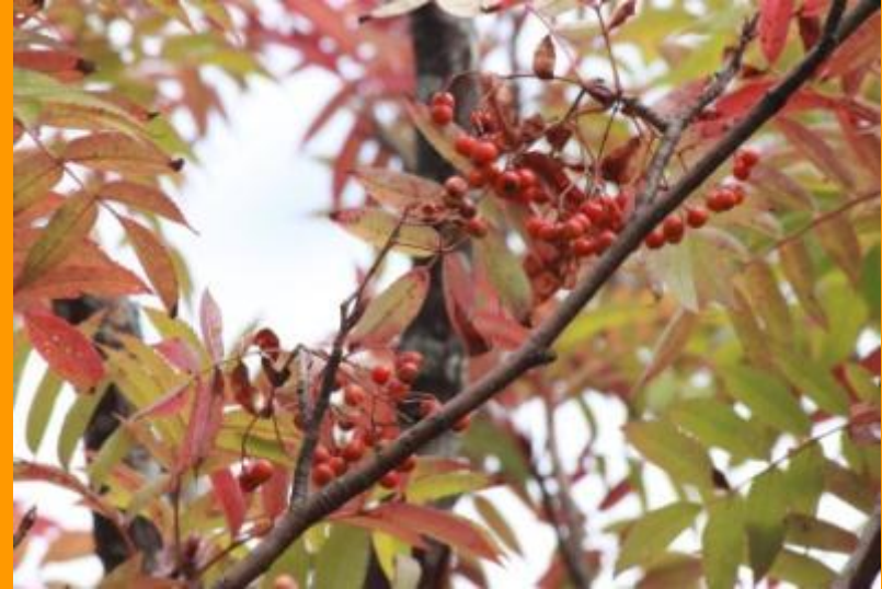
ななかまどの実(平成 25 年 9 月 25 日)