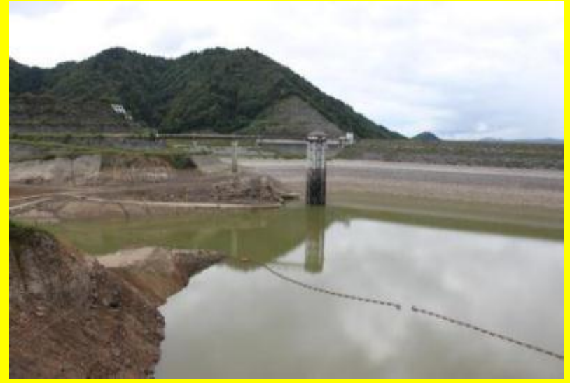
渇水時のダム(平成 24 年 9 月 19 日)