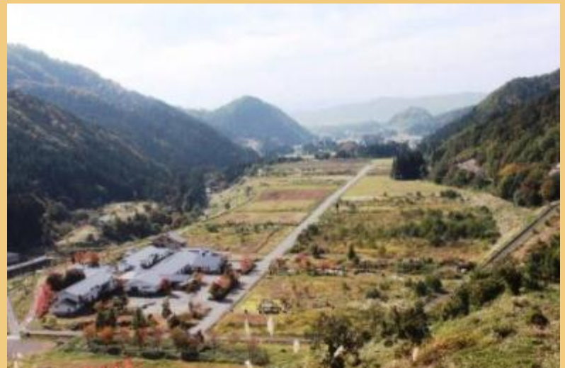
日中ダム下流の風景(平成 25 年 10 月 30 日)