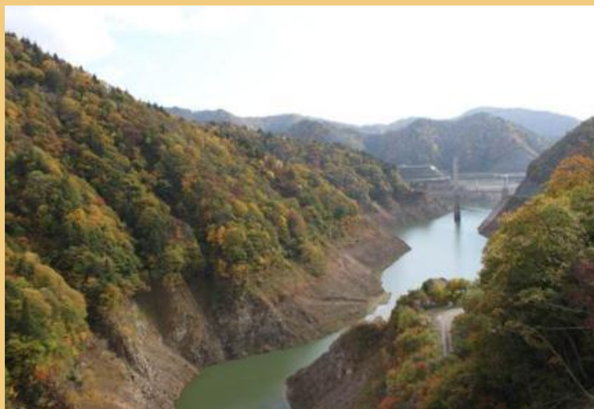
紅葉が綺麗です(平成 24 年 10 月 29 日)