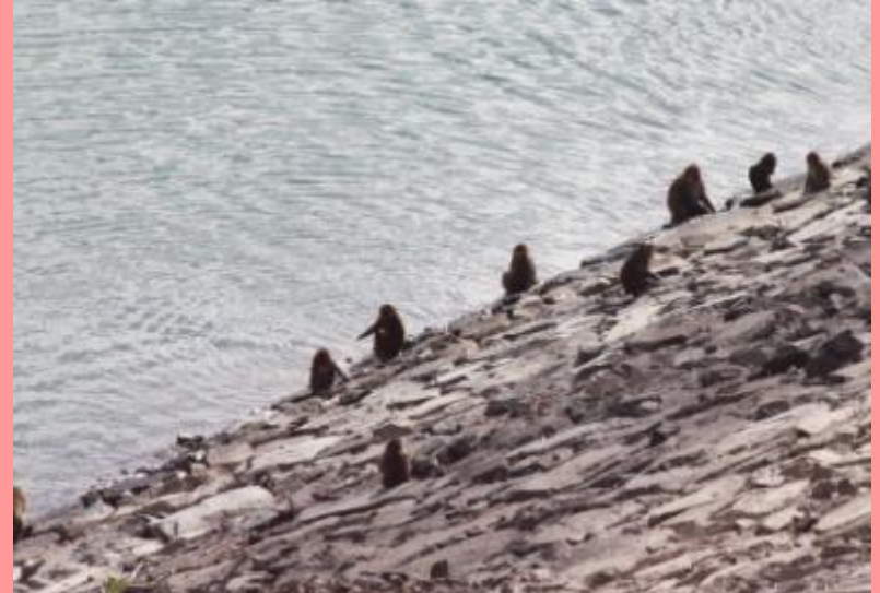
水遊びにきた猿の群れ(平成 25 年 10 月 2 日)