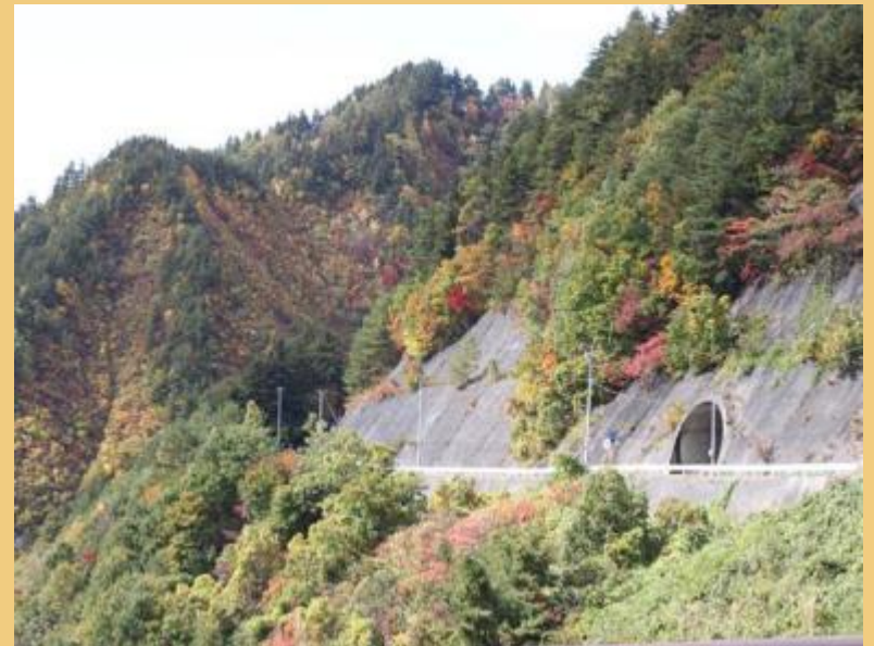
ダム周辺の紅葉(平成 24 年 10 月 29 日)