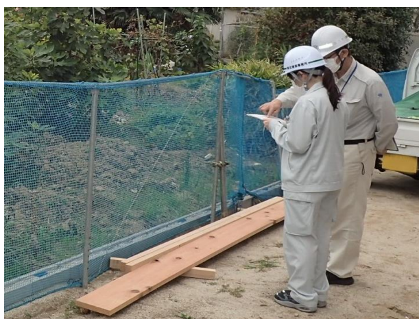
↑ 違反パトロールの様子

その中でも、福島県職員になれば地元へ貢献できる、また、福利厚生が充実しており安心して働くことができると考え志望しました。