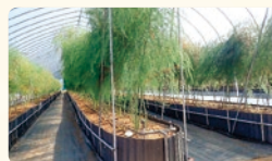
アスパラガスの高畝栽培(効率的に収穫できます)

温暖化に伴う高温や異常気象の影響による農作物の収量・品質低下や、担い手不足に対応するため、早急に安定生産技術の確立を図ります。