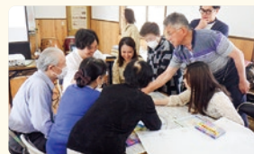
災害図上訓練の様子

県民の防災意識(自助)の向上を図るとともに、地域の防災活動(共助)を活性化させ、大規模災害への備えとして地域防災力の強化を推進します。