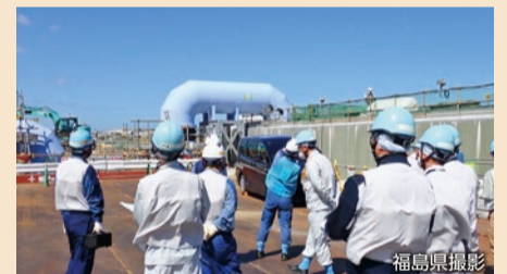
ALPS処理水希釈放出設備

タンクエリアに貯蔵しているALPS処理水は、希釈前に、トリチウム以外の放射性物質が「環境へ放出する場合の国の基準」を下回っていることを確認します。この設備でALPS処理水を海水で100倍以上に希釈し、トリチウムを「環境へ放出する場合の国の基準」の40分の1となる1,500ベクレル/L未満にします。希釈されたALPS処理水は海底の放水トンネルを経由して、1km沖合に設けた放出口から海へ放出されます。