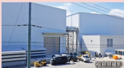
固体廃棄物貯蔵庫第10棟

事故後に発生した固体廃棄物は、「ガレキ類」「伐採木」「使用済保護衣等」に分類し、さらに「ガレキ類」は表面線量率ごとに区分し、屋外でシートを被せるなどにより一時保管されています。現在、2028年度内のガレキ等の屋外一時保管解消に向け、一時保管エリアの解消作業や減容設備(焼却設備等)・屋内保管設備の整備が進められています。