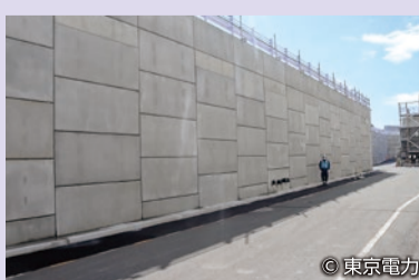
除染装置(プロセス主建屋)海側の防潮堤

日本海溝津波対策として、総延長約1km、海拔13.5~16m(本体部)の防潮堤を設置しています。津波による浸水を抑制し、建屋への流入に伴う滞留水の増加を防止するとともに設備の被害を軽減することにより、廃炉作業の遅延リスクを緩和します。