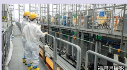
多核種除去設備(ALPS: アルプス)

原子炉建屋に滞留する汚染水から様々な放射性物質を取り除いて浄化するための設備の一つ。トリチウム以外の放射性物質を国の定めた規制基準を満たすまで取り除くことができる性能を持っています。