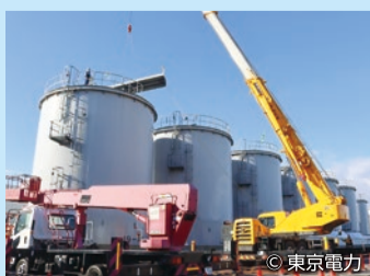
タンク解体作業の様子

ALPS等により、汚染水からトリチウム以外の放射性物質を国の定めた規制基準未満となるまで取り除いたものは「ALPS処理水」となり、タンクに貯蔵されます。2025年2月13日現在のALPS処理水等の貯蔵タンク数は1,034基です。ALPS処理水の海洋放出に伴い、不要となったタンクは計画的に解体を行います。タンクの跡地は、廃炉に必要な施設の敷地とする計画です。