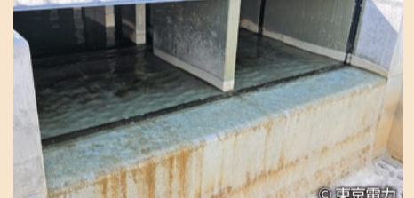
ALPS処理水希釈放出設備