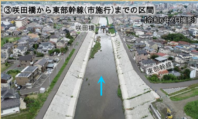
③ 咲田橋から東部幹線(市施行)までの区間 【令和6年7月撮影】

② 大窪橋から咲田橋間の築堤護岸及び堤防道路が令和4年度に完成しました。(咲田橋施工範囲を除く) 現在、咲田橋架け替えのため旧橋を撤去し、新しい橋梁の下部工を実施しています。