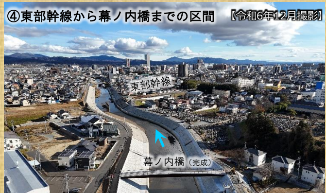
④ 東部幹線から幕ノ内橋までの区間 【令和6年12月撮影】

④ 東部幹線から幕ノ内橋上流部間の築堤護岸が概ね完成しました。令和5年度に幕ノ内橋上部工が完成しました。