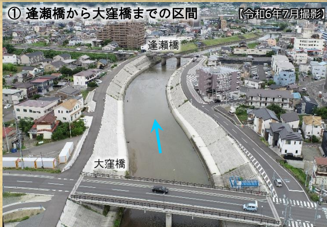
① 逢瀬橋から大窪橋までの区間 【令和6年7月撮影】

逢瀬川の河川改修は、県道荒井郡山線道路改良事業(令和3年度完了)や郡山市施行の伊賀河原土地区画整理事業や市道麓山一丁目久保田線道路整備事業などと連携を図りながら整備を進めています。