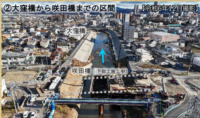
② 大窪橋から咲田橋までの区間 【令和6年12月撮影】

② 大窪橋から咲田橋間の築堤護岸及び堤防道路が令和4年度に完成しました。(咲田橋施工範囲を除く) 現在、咲田橋架け替えのため旧橋を撤去し、新しい橋梁の下部工を実施しています。