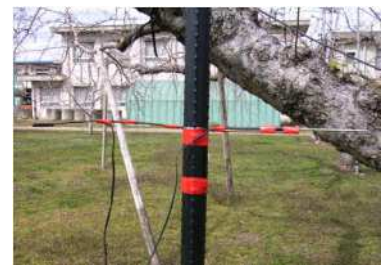
図2 温度センサーの設置方法