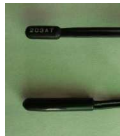
図1 樹脂製の汎用センサー