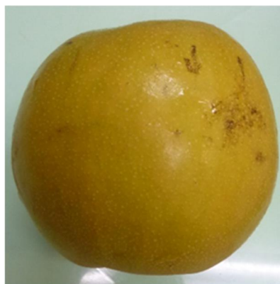
図1 判定○の果実(短果枝)