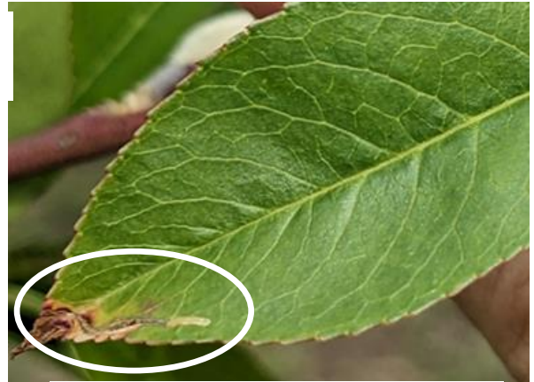
図3 モモハモグリガの被害葉 （令和5年5月撮影）