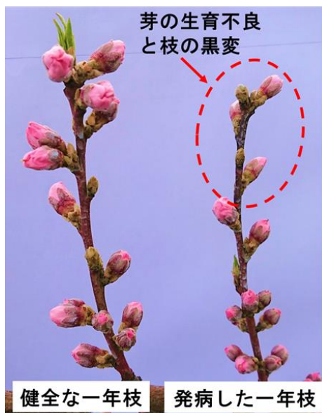
図1 春型枝病斑の特徴