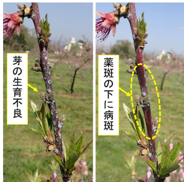
図2 薬斑によって発見困難な病斑