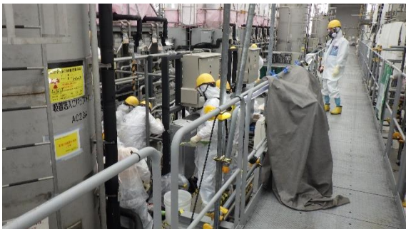
(写真3) 設備からの水抜き作業