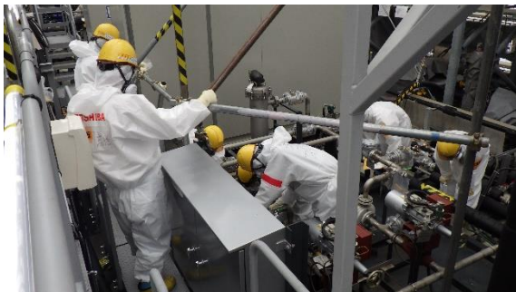
(写真2) 試運転準備作業