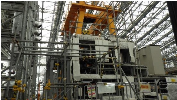
(写真1①) 完成したヤグラ