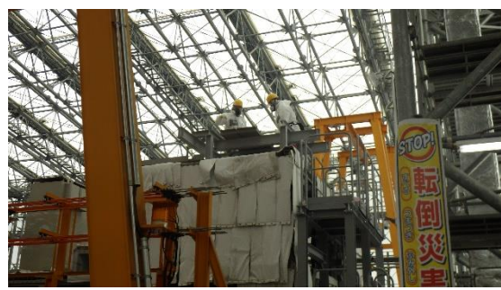
(写真1②) 組立作業 (R7.2.26)