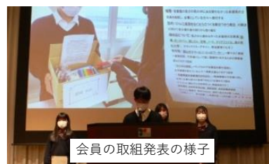
会員の取組発表の様子