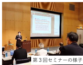
第3回セミナーの様子