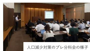
人口減少対策のプレ分科会の様子