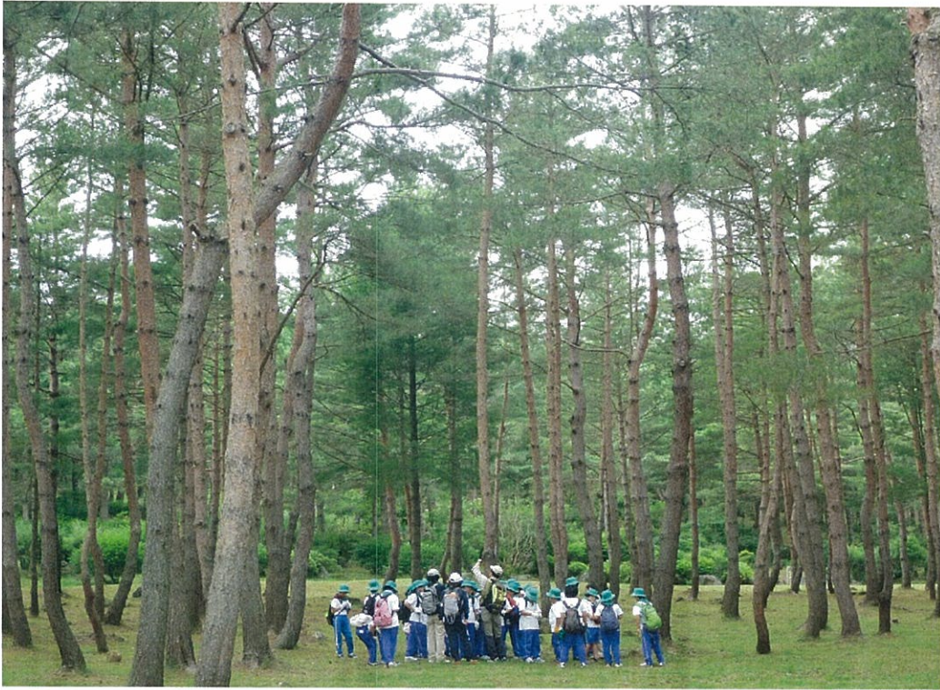
自然観察を楽しむ子どもたち(平成25年7月)