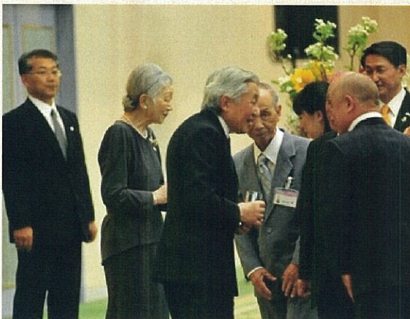
歓迎レセプション