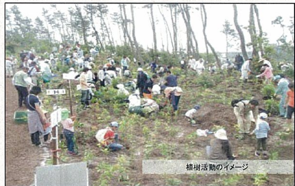
植樹活動のイメージ