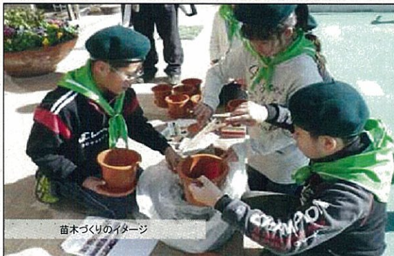
苗木づくりのイメージ