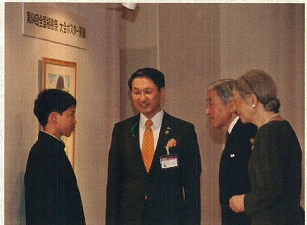
両陛下による作品御覧