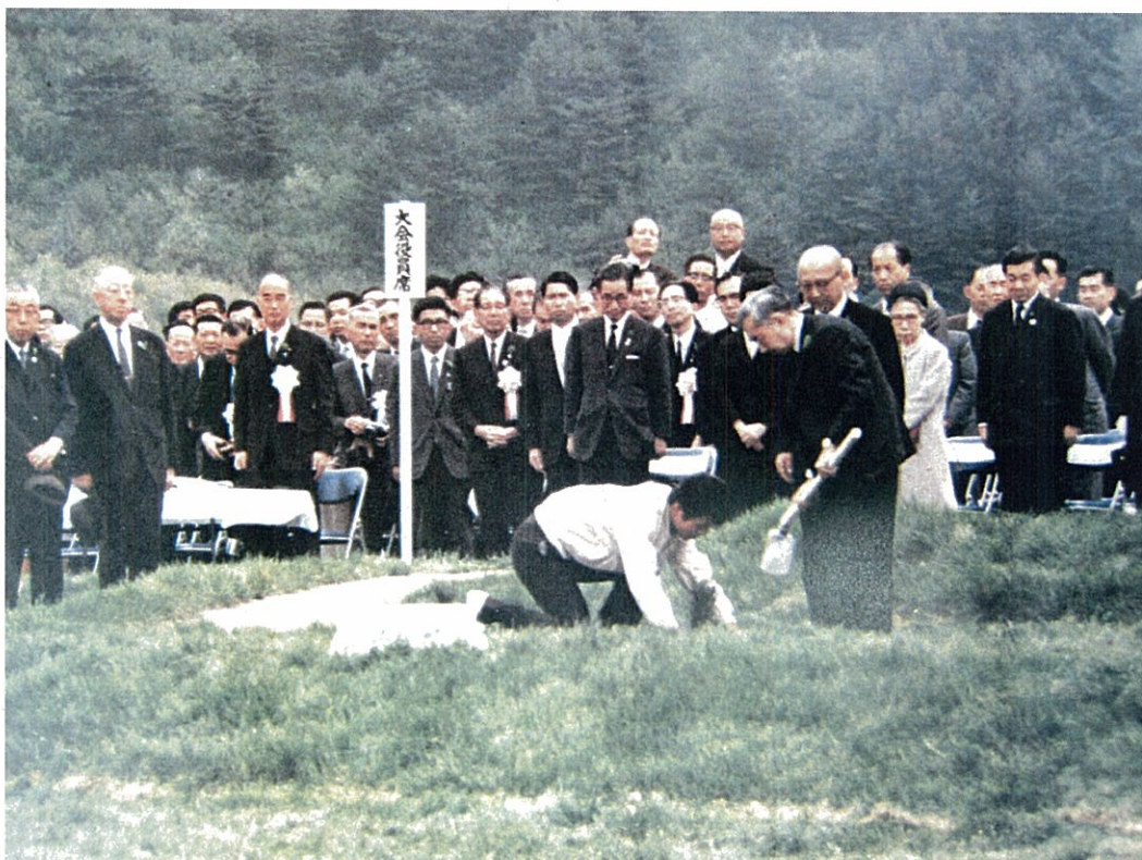
昭和45年5月19日 (テーマ「後継者の森」、参加者22,300人)