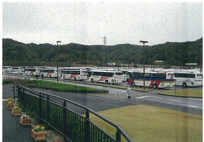
大型バスが車列をつくる駐車場（鳥取県）