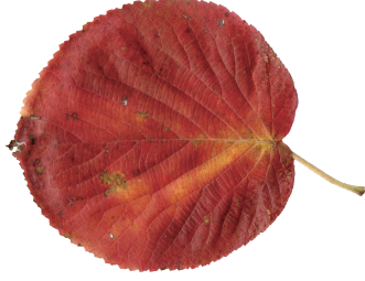
オオカメノキ (紅葉)