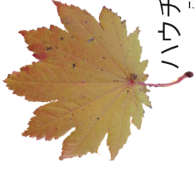
ハウチワカエデ (紅葉)