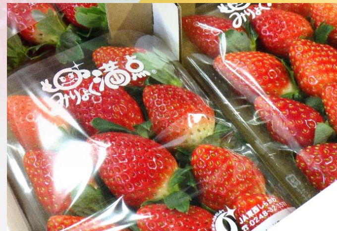
【大切にパック詰めされて皆様の元へ】