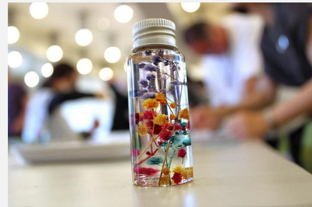
ハーバリウム体験 (西郷村観光協会・にしごう体験隊)