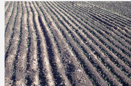
【西郷村の小麦の様子】