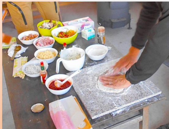
農家民宿・ピザ焼き体験 (塙町観光協会・四季彩菜工房)