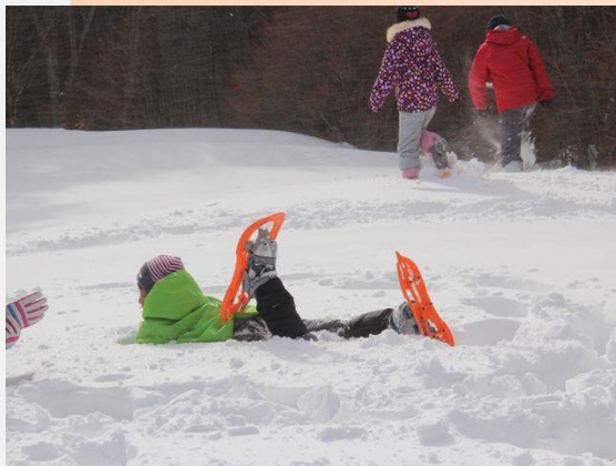
スノーシューハイキング (那須甲子青少年自然の家)