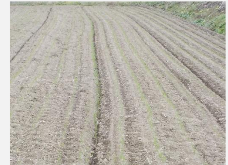
【埴町の大麦の様子】