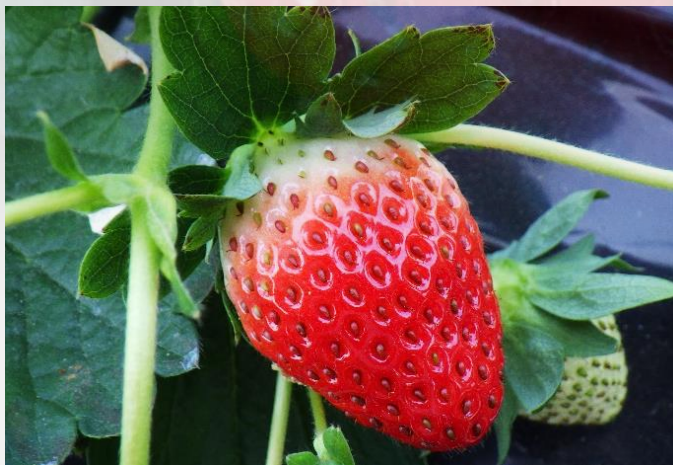
【収穫直前のつややかに色づいたいちご】