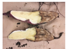
写真2 なり首からの腐敗 (イモの切断面)

問 福島県病害虫防除所 ☎024(958)1709 メール yosatsu@pref.fukushima.lg.jp