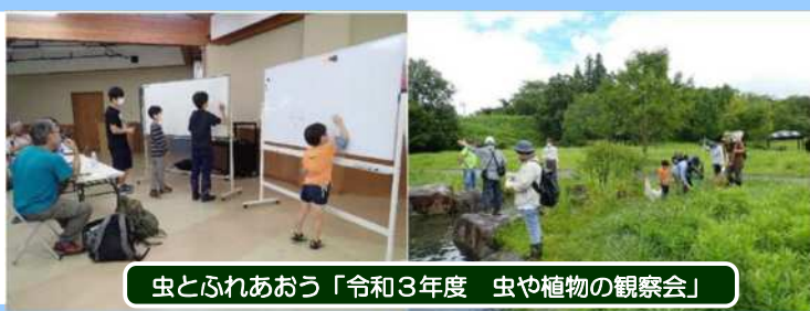
虫とふれあおう「令和3年度 虫や植物の観察会」