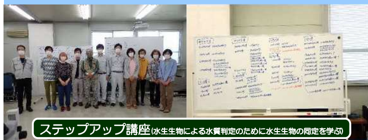
ステップアップ講座(水生生物による水質判定のために水生生物の同定を学ぶ)