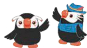
北方領土イメージキャラクター 「エリカちゃん」、「エリオくん」