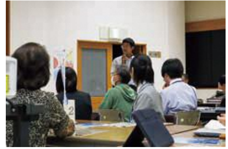
高校生からの感想発表