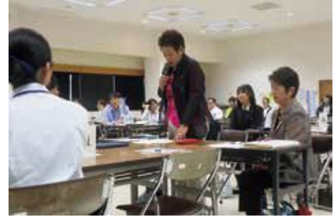
会員からの感想発表