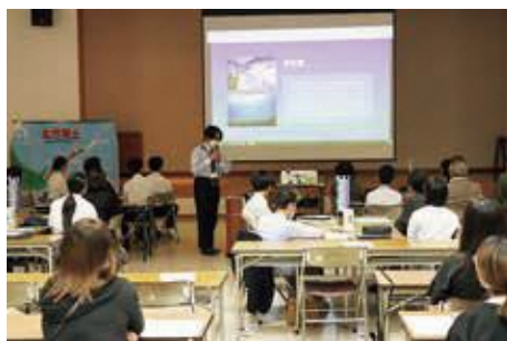
各中学校からの報告