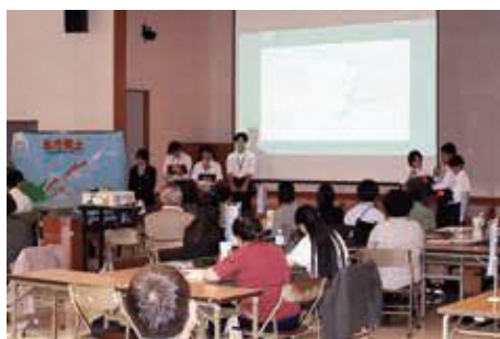
各中学校からの報告

郡山市労働福祉会館大ホールで、令和7年度現地視察事業に参加した生徒による報告会を開催しました。報告会では、生徒が現地で見えて聞いて体験して、感じたことや考えたこと、現地視察事業を通じて学んだことなどを発表してくれました。また、スマートフォンを使ったクイズやAIを活用した発表など、視察の報告とはまた別に、出席者の興味を引く工夫も凝らされており、生徒からは、「他校の発表を聞いて、自分たちで調べたこと以外にも北方領土に関する知識を学ぶことができた。また、意見交換会をしたことにより、さらに北方領土について関心を持てた。」といった感想がありました。また、参加した県民会議会員からは、「素晴らしい意見が聞けて、大変勉強になりました。北方領土に対する考えが変わりました。」等、生徒と会員との交流を通じてより北方領土に対しての知識・理解を深めることができました。