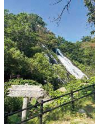
オシンコシンの滝

開陽台の見学後、北海道の雄大な自然に触れていただくため、移動途中で斜里町にあるオシンコシンの滝を訪問しました。