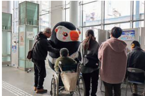
北方領土エリカちゃん