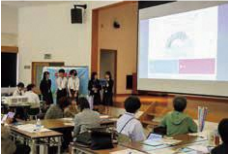
各中学校からの報告