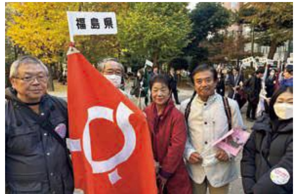
中央アピール行動