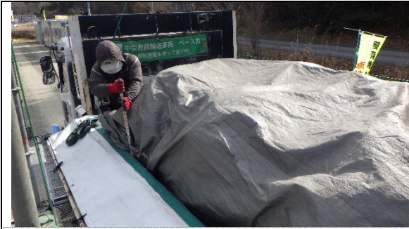
遮水シート掛けの状況