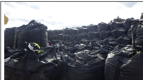
除去土壌の保管状況