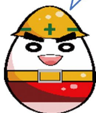
イメージキャラクター 「起き上がり五郎」

起き上がり小坊師をイメージした「起き上がり五郎」を管内の工事現場の標識などで使用しています。