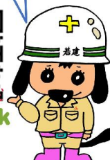
イメージキャラクター 「若犬」