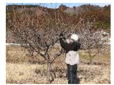
(カフェでのお手伝い) (農業(果樹)のお手伝い)