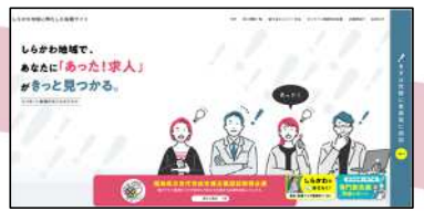
(しらかわ地域に特化した転職サイト)

「しらかわ地域に特化した転職サイト」による情報発信と首都圏向け広報、企業説明会の実施に加え、 首都圏の大学生等を対象に、会社訪問と地域体験を組み合わせたツアー を実施することで、「転職・仕事」を契機とした移住を促進する。