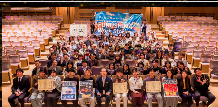
2025年度発表審査会の様子

↑個別説明会 お申し込み用 ※定員は24名です。 本選考へのエントリーは、個別説明会の参加が必須です。 締切を過ぎた申し込みは無効となりますので、 お早めにお申し込みすることをお勧めします。