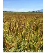
成熟期の「夏黄金」ほ場