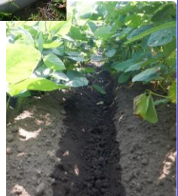
FOEASによる開花期以降の畝間灌水の様子