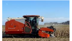
大豆収穫作業の様子