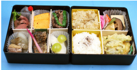
※画像は令和7年度開催時に提供したのものになります

南会津の旬の食材をふんだんに使った特製弁当。地元野菜や、卵など山里の味覚をぎゅっと詰め合わせました。この機会にぜひご賞味ください。